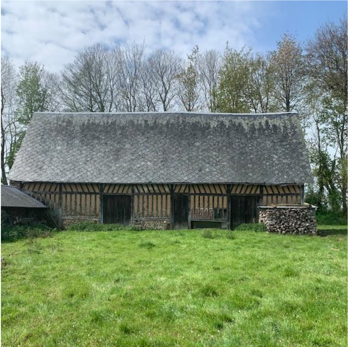
Le cellier a une longueur d'environ 17 m. Il a été construit en briques en soubassement et colombage. La toiture est couverte en ardoises.