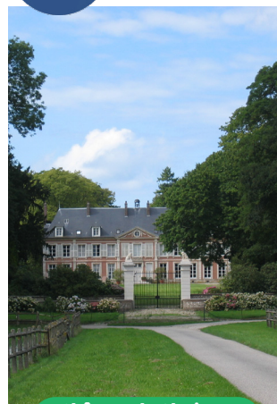
Château de Glatigny (propriété privée)