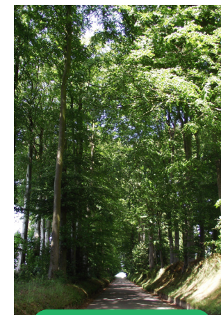
Les talus plantés