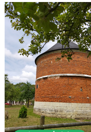
L'Ecomusée de la Pomme et du Cidre