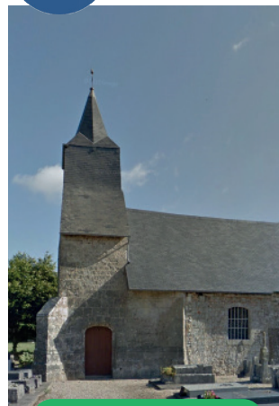
Chapelle de Bielleville