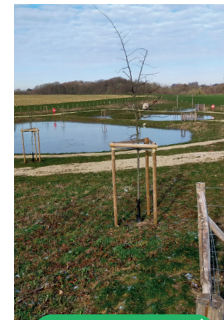
L'Espace de Biodiversité de Bénarville