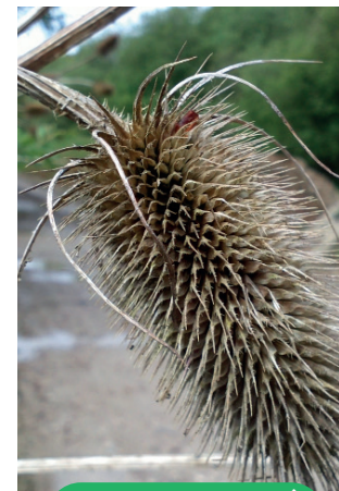
Zone humide de la vallée de St-Maclou (Vaux de Limard / Val à Loup)